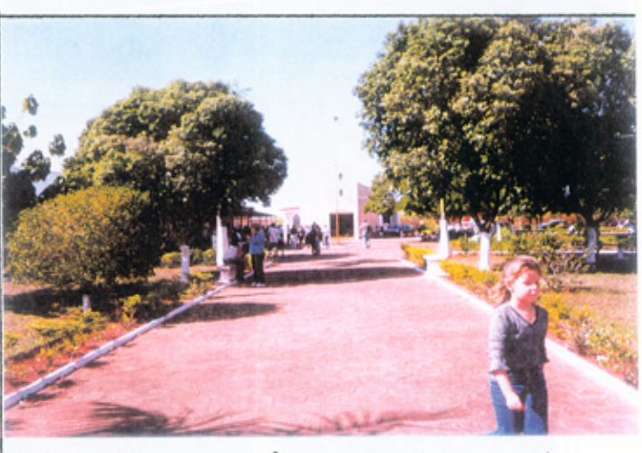
Na foto abaixo: Ao redór da praça, Vêiculos e Bárracas, fázem parte dos festejos. (Foto: 11/06/2.000)