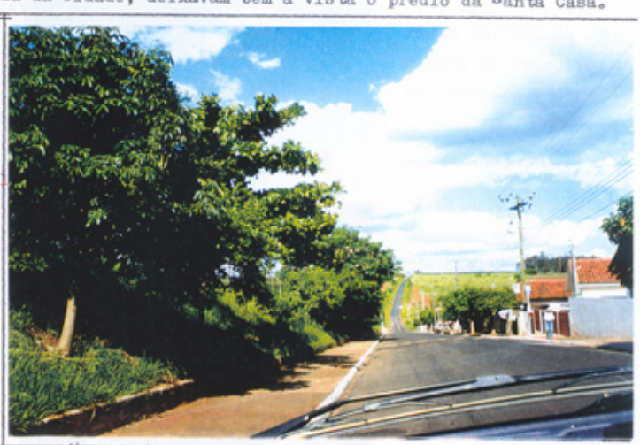
Foto a direita: Saida da cidade de Itápollis, em direção ao Bairro do Quadro. A estrada passando,

entre o Fairro Santa Euzia, e arvores que cerca m o terreno pertencente ao Abrigo Rainha da Paz, hoje pavimentada, foi no passado, a té recentemente, estrada de terra, ligando Itapolis, não somente ao Quadro, mas a inumeras cidades. PAG. 102