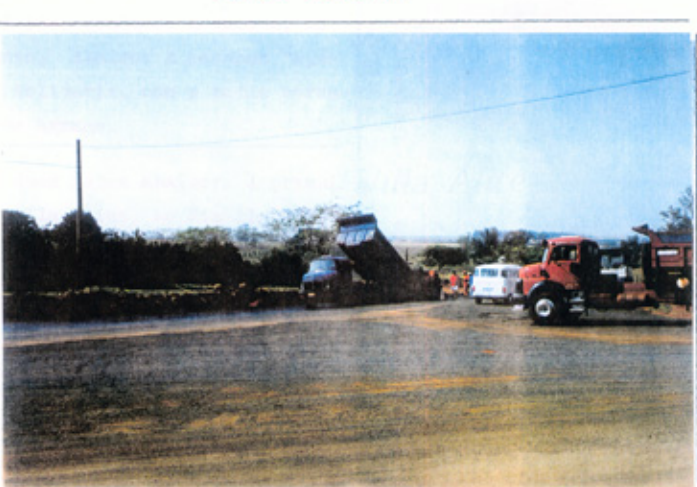
Poto: (15/09/99) A Companhia de asfalto, responsavel pela pavimentação, (SPEL) desnvolvendo seu trabalho num trecho da estrada.

Vila Alice: Comunidade, distante do Bairro do Quadro, mais ou menos 6 quilometros.