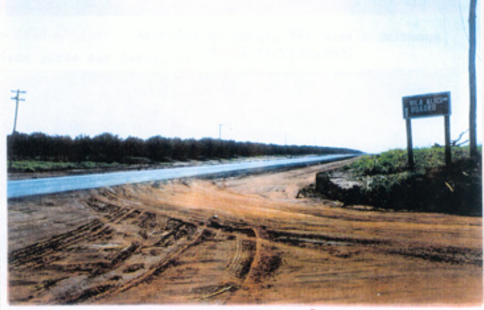
Poto acima: Entrada da estrada que a Vila Alice. Bate ponto, fica a 4 quilometros do Quadro. Nota-se que na ocasião da foto, (15/09/99) a estrada Quadro - Itapolis, já estava cobesta pelo asfalto.

Hoje, Vila Alice, e Bairro do Quadro, são comuni dades irmas. Alem de pertencerem ao Municipio de Itapolis, existe amizade entre as familias, devido a proximidade entre as localidades.