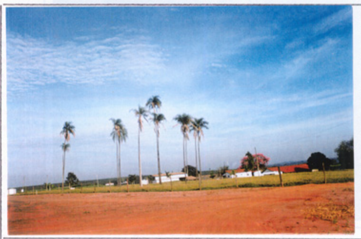
Foto abaixo: Fazenda Cantaboga, de Adolfo Guandalini Neto. Lugar mais

nho de cana, onde se fabricava otima aguardente. Engenho que se encontra, hoje, desativado./