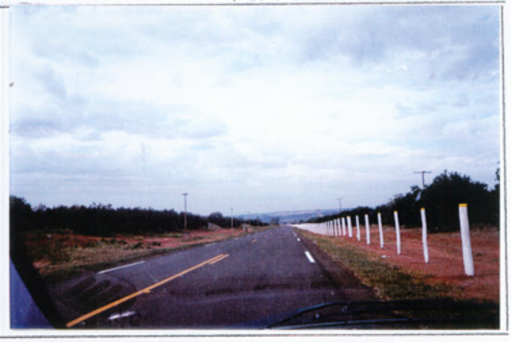
Foto a direita: Com a chegada do as falto, se fizeram presentes, a margem da Estrada, benfeitorias que mudaram o visual da

mesma. Heste trecho da estrada, entre os ríos: São Lourenço e São Pedro, uma nova e bem traçada cerca, com os morrões pintados de branco, se estende por centenas de metros, dando um destaque a via pavimentada.